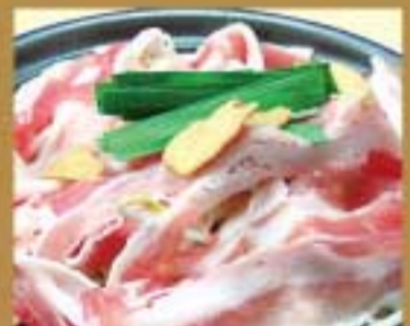
豚バラともやしの蒸し焼 ● 298Kcal ● 塩分1.7g 400円(税込)