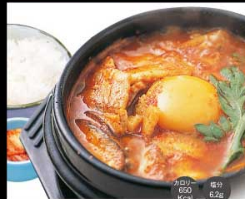
豚キムチスンドゥブ (ご飯・キムチ付)