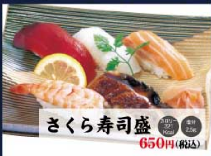
さくら寿司盛 カロリー 321 Kcal 塩分 2.5g 650円(税込)