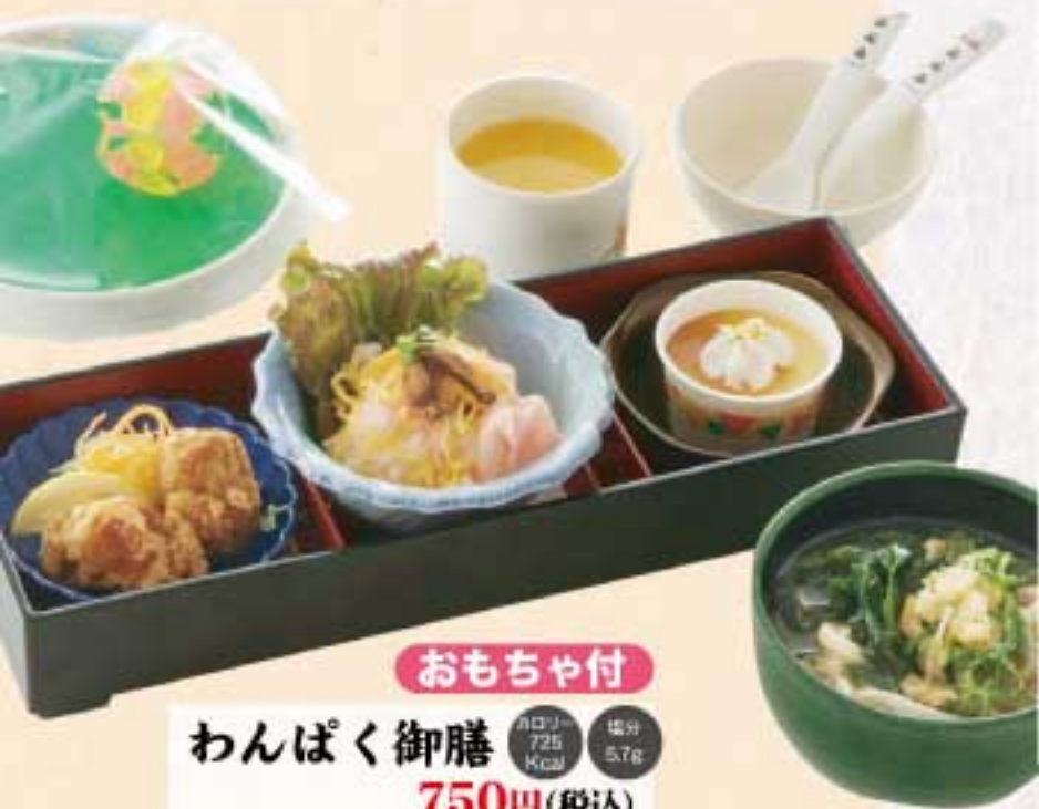
おもちや付 わんぱく御膳 750円(税込) カロリー 725 Kcal 塩分 5.7g