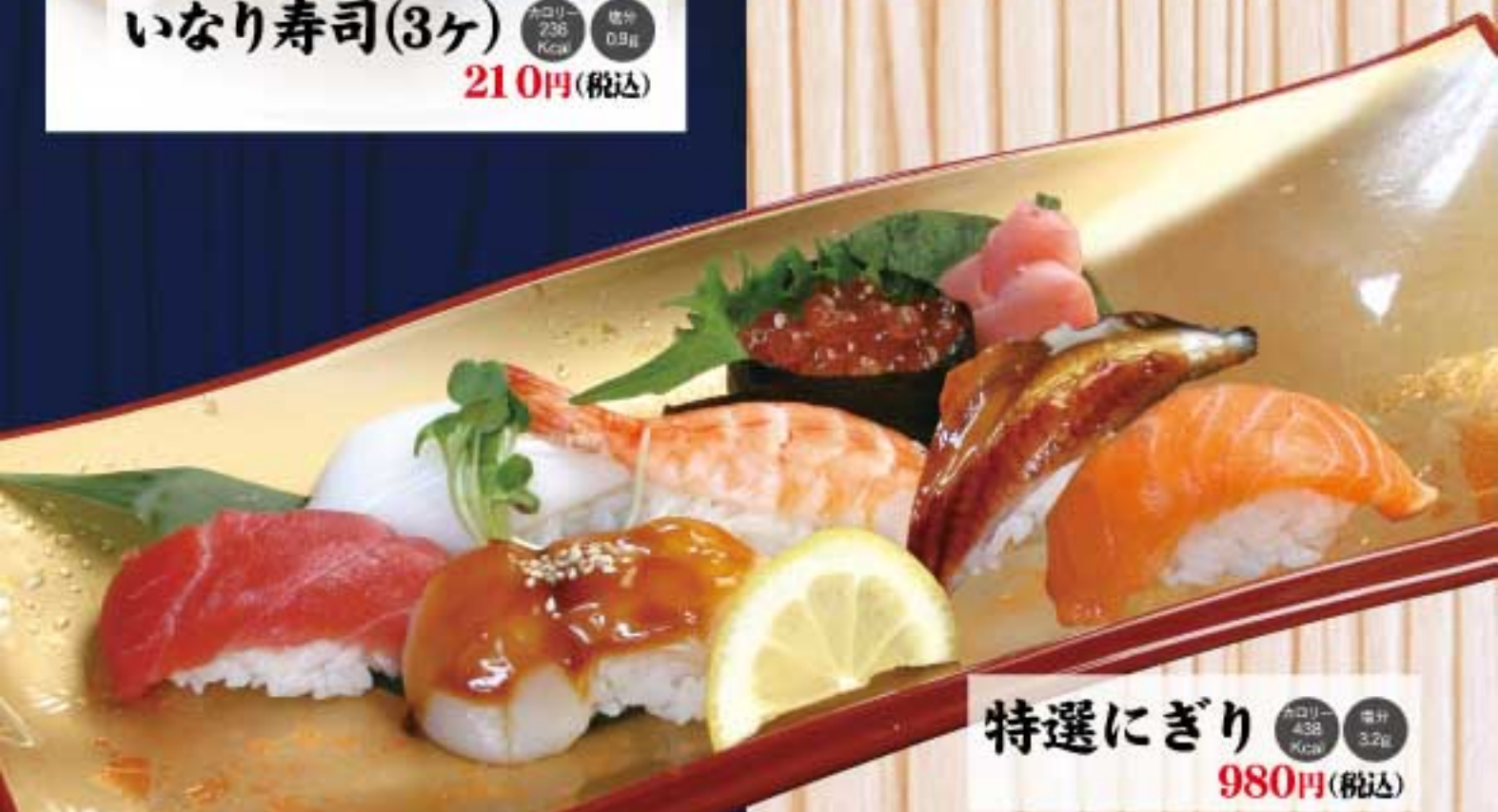
特選にぎり カロリー 438 Kcal 塩分 3.2g 980円(税込)