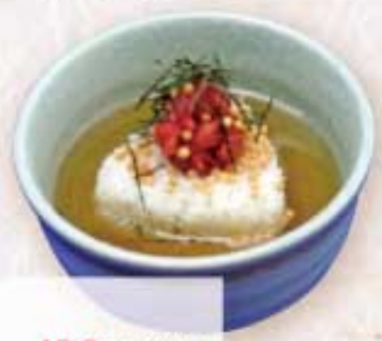
梅茶漬 430円(税込) カロリー 233 Kcal 塩分 5.7g