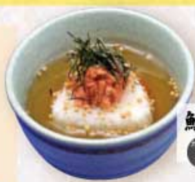
鮭茶漬 430円(税込) カロリー 270 Kcal 塩分 4.2g