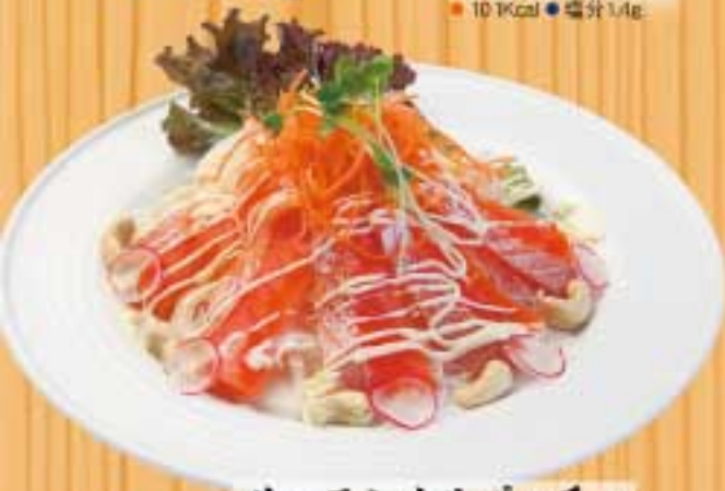
サーモンカルパッチョ ● 363Kcal ● 塩分2.5g 680円(税込)