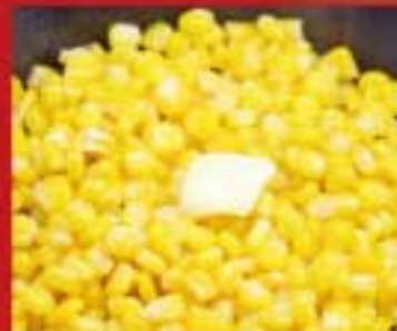
バターコーン ● 319Kcal ● 塩分0.7g 360円(税込)