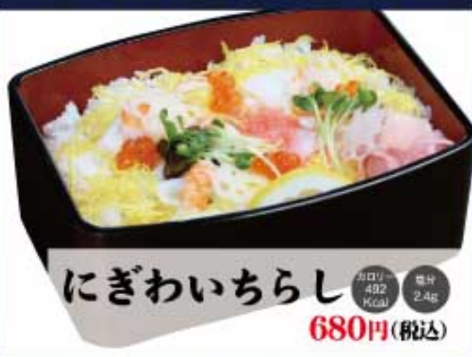
にぎわいちらし カロリー 492 Kcal 塩分 2.4g 680円(税込)