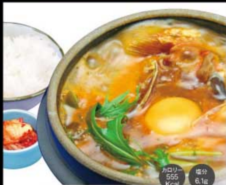
スンドゥブ (ご飯・キムチ付)