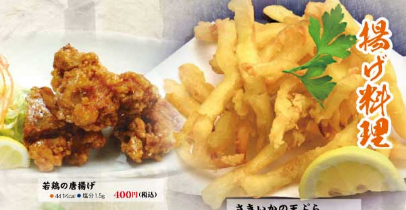
若鶏の唐揚げ ● 441Kcal ● 塩分1.5g 400円(税込)