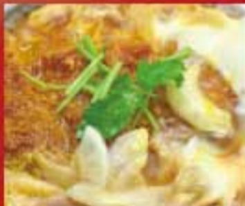
豚カツとじの陶板焼 ● 498Kcal ● 塩分2.2g 450円(税込)