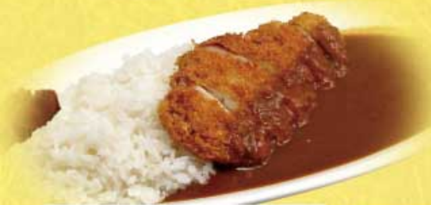
ローズかつカレー (サラダ付) 760円(税込) カロリー 1,075 Kcal 塩分 5.0g