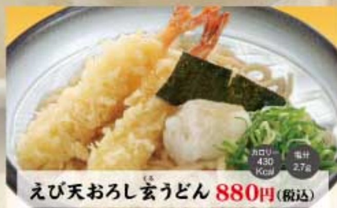
えび天おろし玄うどん