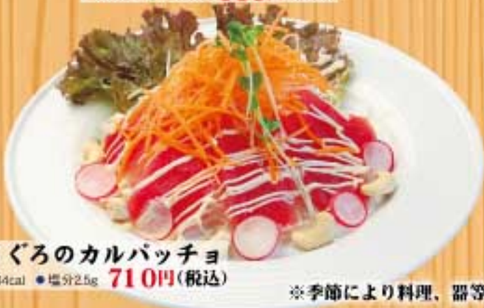
まぐろのカルパッチョ ● 344cal ● 塩分2.5g 710円(税込)