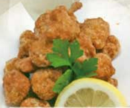
とりのなんこつ ● 171Kcal ● 塩分2.2g 320円(税込)