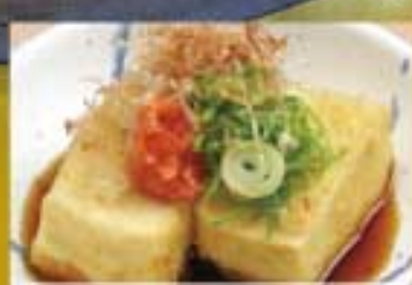
揚げ出し豆腐 ● 173Kcal ● 塩分0.4g 350円(税込)