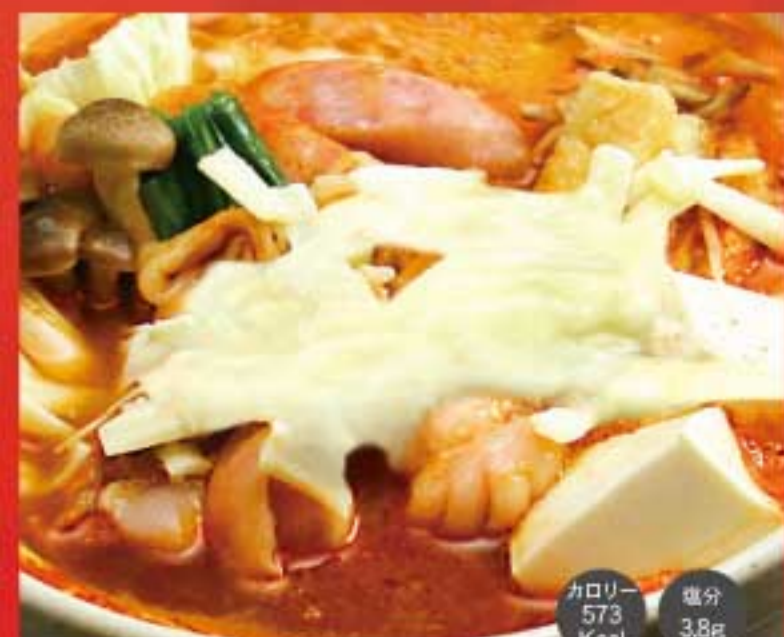
明洞プーデチゲ鍋 (ラーメン入)