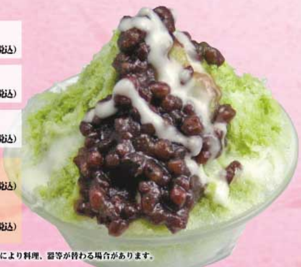
トッピング(金時) カロリー 251 Kcal 糖質 0.2g 150円(税込)