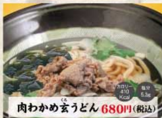
肉わかめ玄うどん