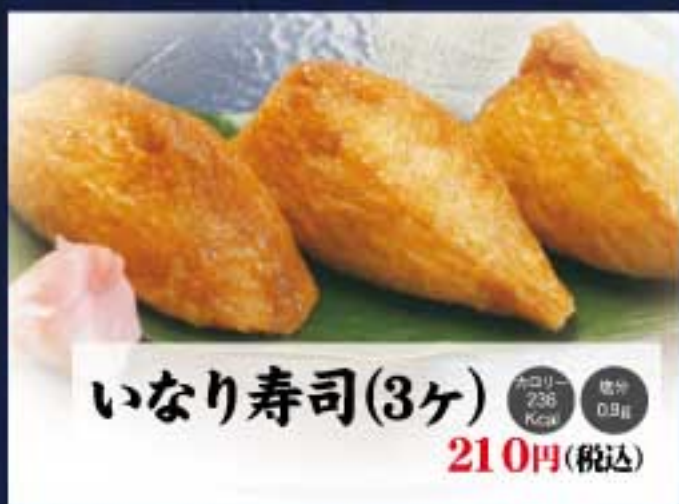
いなり寿司(3ヶ) カロリー 236 Kcal 塩分 0.9g 210円(税込)