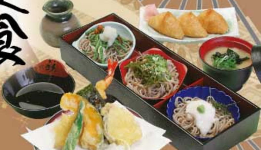
十割三色蕎麦セット