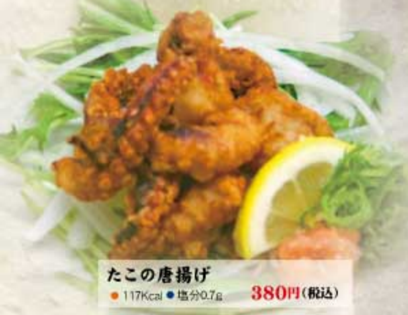
たこの唐揚げ ● 117Kcal ● 塩分0.7g 380円(税込)