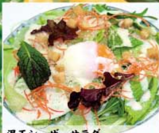
温玉シーザーサラダ ● 296Kcal ● 塩分1.5g 500円(税込)