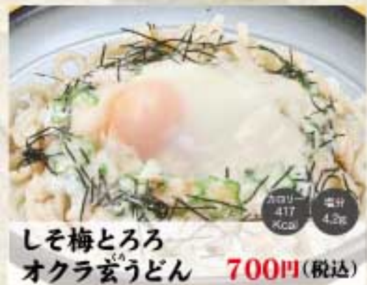
しそ梅とろろ オクラ玄うどん