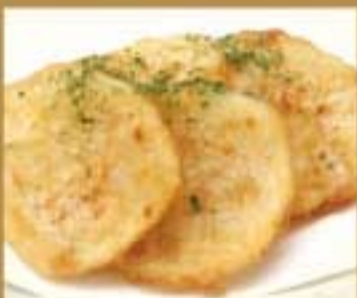
長芋の唐揚げ ● 179Kcal ● 塩分0g 200円(税込)