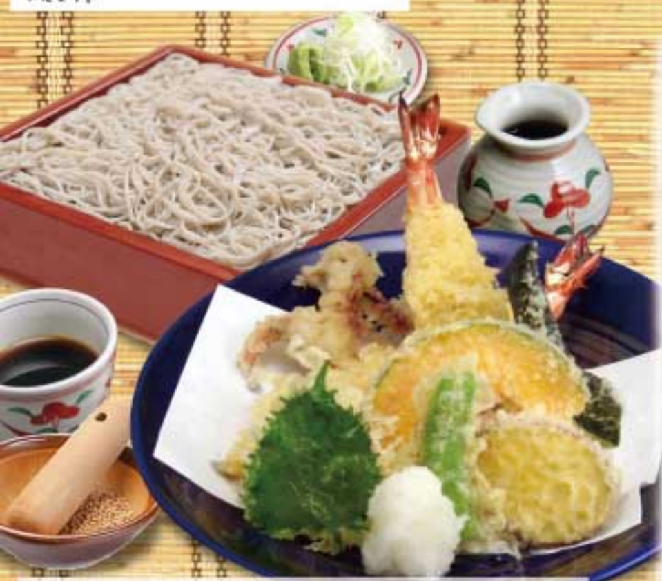
十割天せいろ蕎麦 (湯とう付)

十割（じゅうわり）蕎麦とは、つなぎ（小麦粉など）を使わずに、蕎麦粉と水だけで打つ蕎麦のことです。純粹に蕎麦粉のみを使用するので、蕎麦本来の味が味わえます。