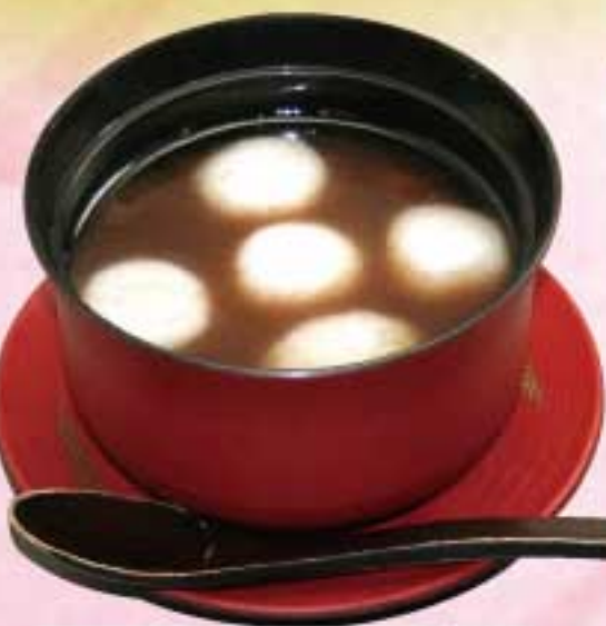
白玉ぜんざい カロリー 283 Kcal 糖質 0.2g 350円(税込)