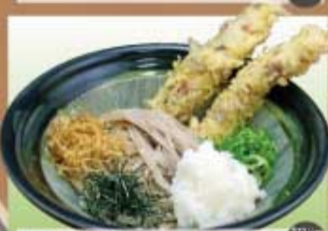
十割ちくわ天おろし蕎麦