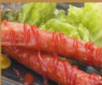
あらびきウインナー ● 309Kcal ● 塩分2.5g 390円(税込)