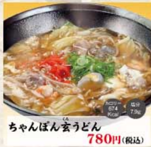
ちゃんぽん玄うどん