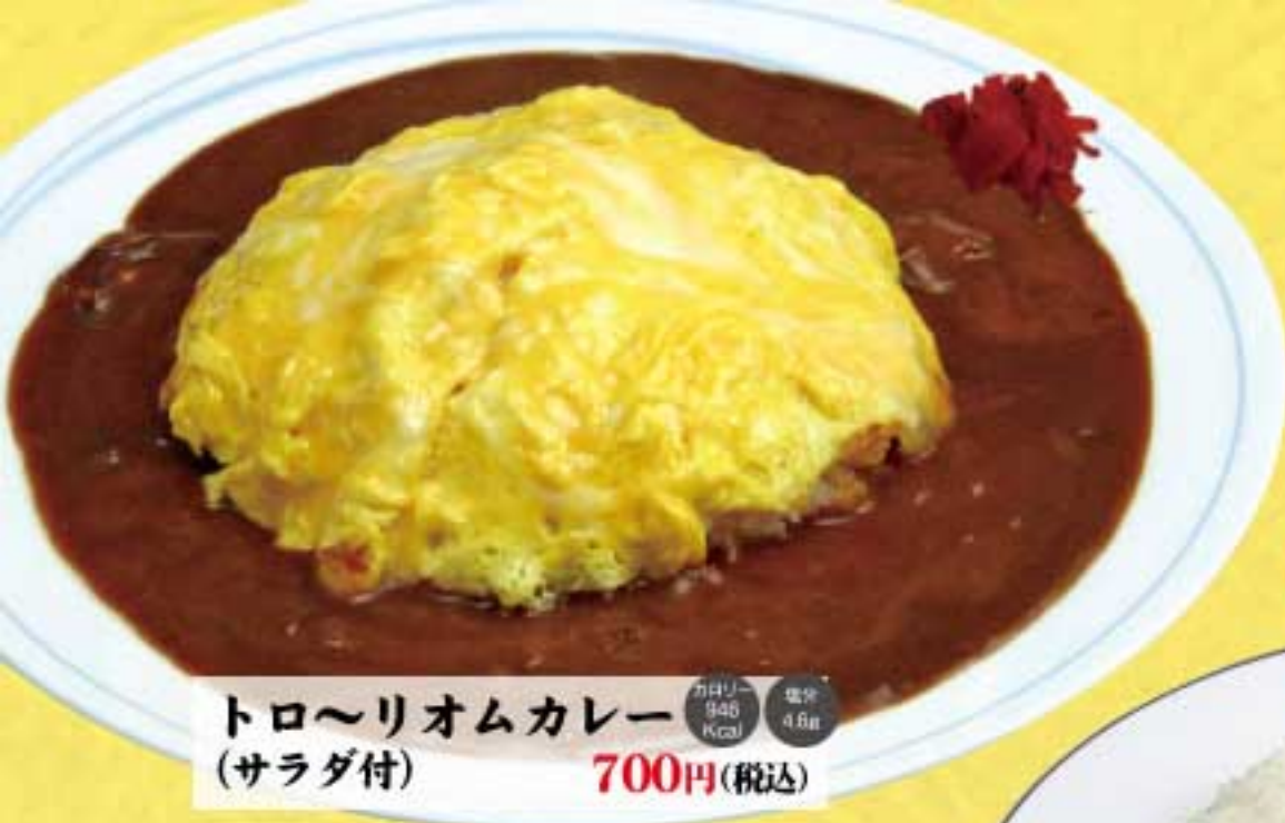
トロ〜リオムカレー (サラダ付) 700円(税込) カロリー 948 Kcal 塩分 4.8g