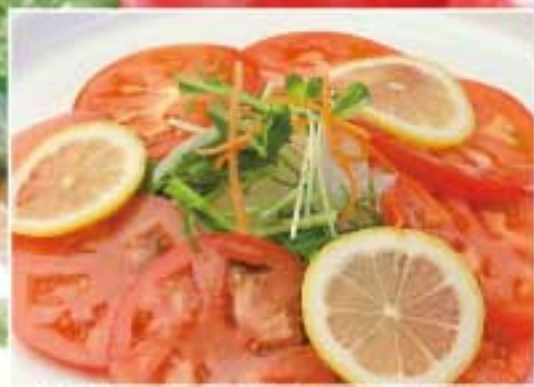
冷しトマトのイタリアンサラダ ● 81Kcal ● 塩分0.4g 400円(税込)