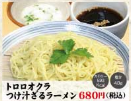
トロロオクラ つけ汁ざるラーメン