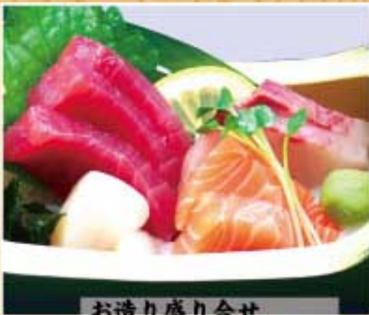
お造り盛り合せ ● 103Kcal ● 塩分1.5g 890円(税込)