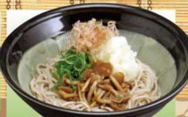
十割なめこおろしとろろ蕎麦