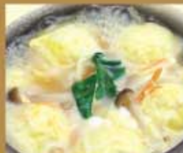
びっくり明石焼玉子あん ● 287Kcal ● 塩分2.9g 560円(税込)