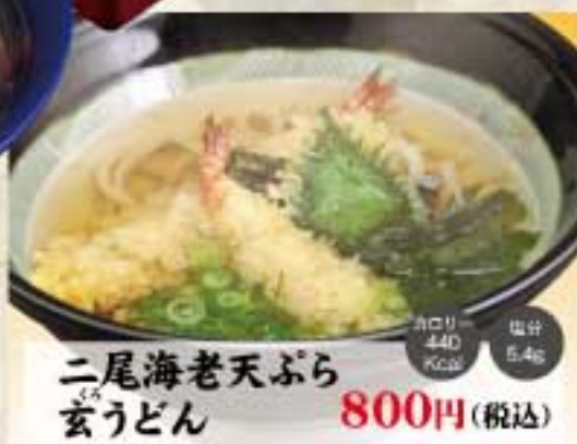
二尾海老天ぶら玄うどん