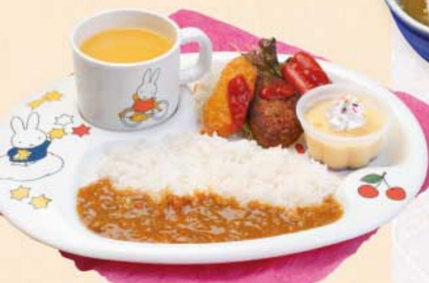
お子様カレーランチ 720円(税込) カロリー 858 Kcal 塩分 6.5g