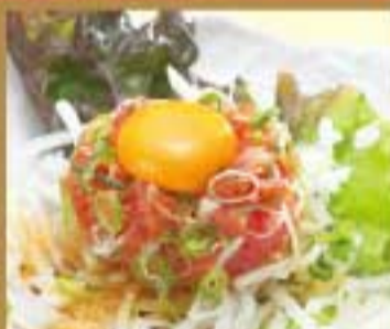
ネギトロユッケ ● 248Kcal ● 塩分2.3g 490円(税込)