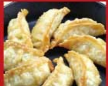
揚げ餃子 ● 179Kcal ● 塩分3.3g 380円(税込)