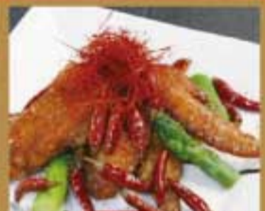
手羽先ピリ辛黒胡椒炒め ● 707Kcal ● 塩分2.4g 550円(税込)