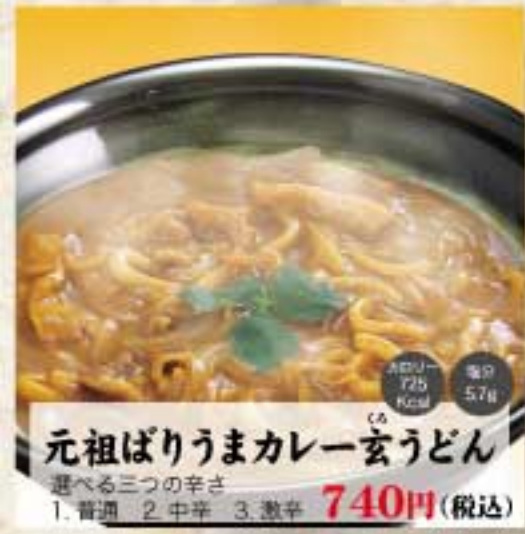
元祖ばりうまカレー玄うどん