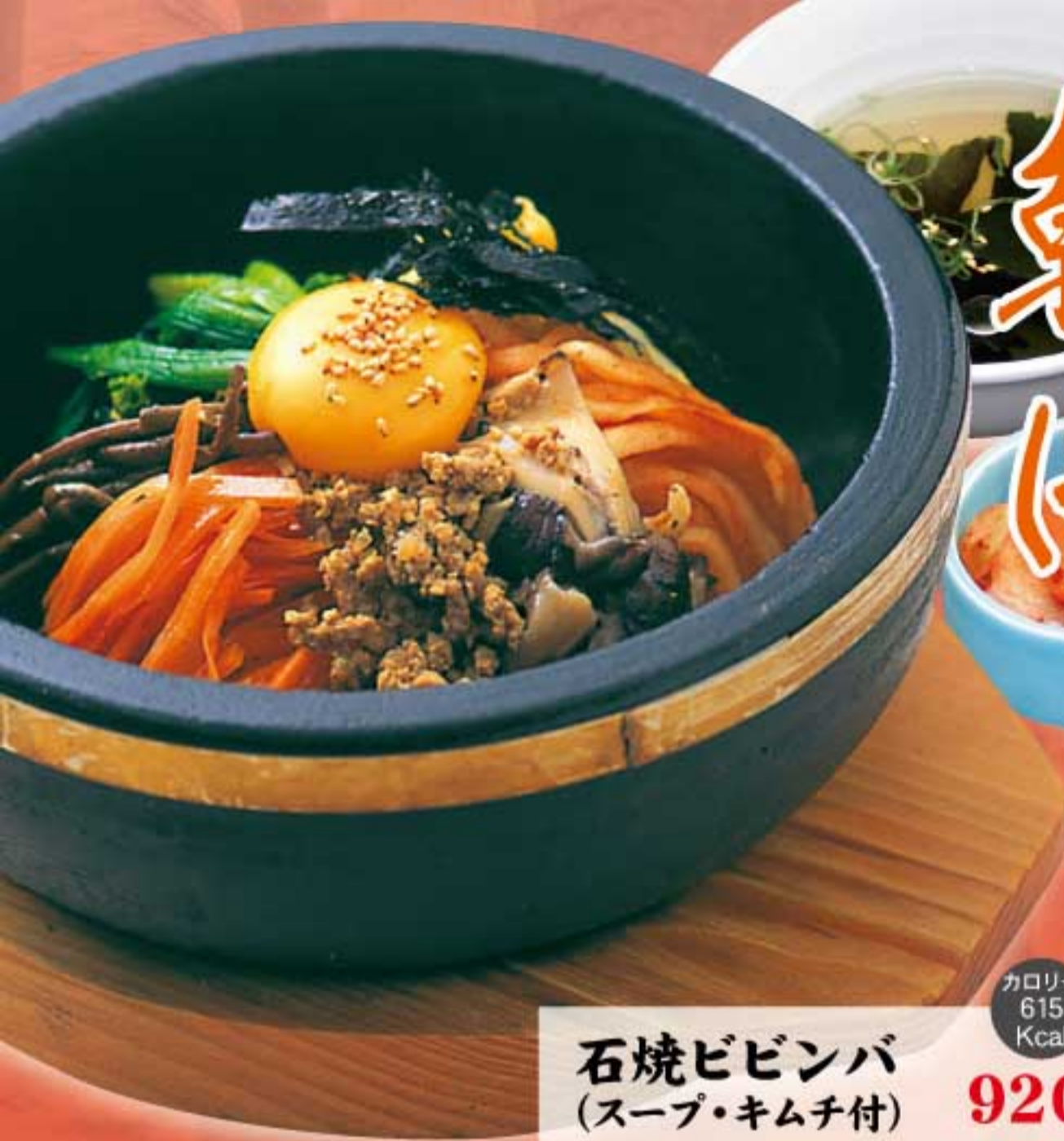
石焼ビビンバ (スープ・キムチ付)