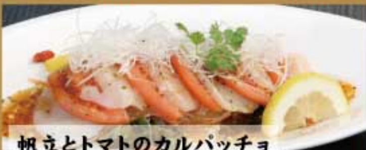
帆立とトマトのカルパッチョ ● 124Kcal ● 塩分1.7g 780円(税込)