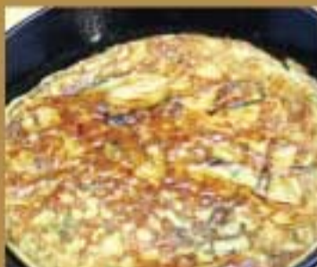
とろろ陶板焼 ● 259Kcal ● 塩分2.2g 480円(税込)