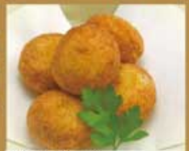
ポテ丸チーズ ● 222Kcal ● 塩分0.7g 410円(税込)