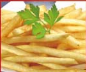
ポテトフライ ● 269Kcal ● 塩分0.5g 320円(税込)