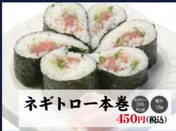
ネギトロ一本巻 カロリー 245 Kcal 塩分 1.6g 450円(税込)