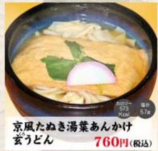
京風たぬき湯葉あんかけ 玄うどん