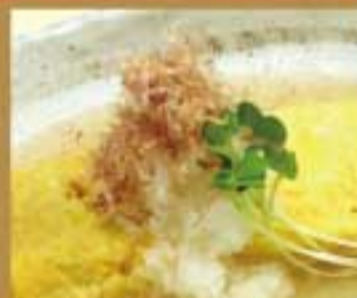
手作りだし巻玉子 ● 291Kcal ● 塩分2.5g 380円(税込)