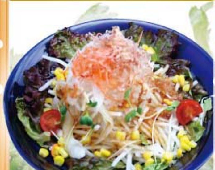
大根もりもりサラダ ● 81Kcal ● 塩分2.8g 370円(税込)