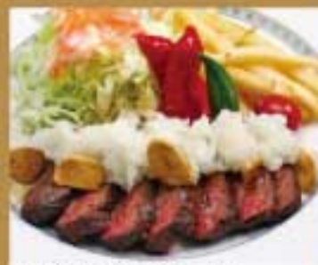
おろし牛ステーキ ● 584Kcal ● 塩分3.1g 950円(税込)