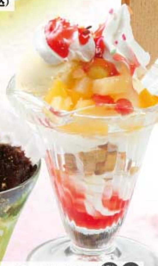
フルーツパフェ カロリー 668 Kcal 糖質 0.9g 420円(税込)