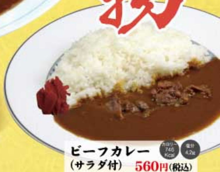
ビーフカレー (サラダ付) 560円(税込) カロリー 746 Kcal 塩分 4.2g